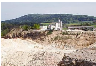
Silbergrube: Waidhaus (6)