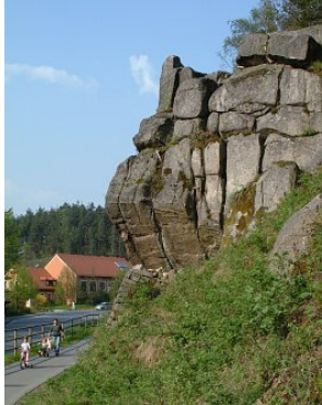
Granit: Störnstein (1)

Neustadt an der Waldnaab ist der Ausgangspunkt des Bockl-Radwegs. Wir befinden uns am Startpunkt in der geologischen Einheit der Zone Erbdorf-Vohenstrauß (ZEV, "Neustädter Scholle") mitten in einem typischen Gneisgebiet. Gneis ist ein 350-500 Millionen Jahre altes Sediment, das durch hohe Temperaturen und unter hohem Druck umgewandelt (=Metamorphose) und manchmal sogar aufgeschmolzen wurde. Welche mächtigen Kräfte dieses ehemalige Sedimentgestein durchbewegt haben, kann man erahnen, wenn man sieht (gerade kurz vor Störnstein) dass die ursprünglich horizontale Schichtung der Ablagerungen sehr steil, ja sogar fast senkrecht steht.