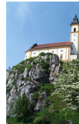
Pegmatit: Pleystein (5)

Kurz bevor wir die Rosenquarz-Stadt Pleystein erreichen, wenden wir den Blick nach Norden, über den Pflaumbach hinweg auf den Hügel "Gsteinach" (F). Dieser sanfte Gneishügel beherbergt gleich drei geologische Besonderheiten und wir können ihn durch die unverkennbare Bebauung mit dem Schullandheim ausmachen. Eindrucksvoll, im Wald verborgen, tritt hier eine Gneis-Felsgruppe zu Tage, die alleine schon sehenswert wäre. Auf der uns abgewandten Seite, also hinterhalb des Schullandheims, tritt ein mächtiger Kalksilikat-Gang an die Oberfläche. In den sandig-tonigen Meeres-Ablagerungen aus denen sich durch Metamorphose die Gneise gebildet haben waren hier dicke kalkreiche Schichtpakete eingelagert. Druck und Temperatur haben im Rahmen der Regional-metamorphose zur Bildung des im frischen Zustand graugrünen faltig-lagigen Kalksilikat-Gesteins geführt. Mineraliensammler konnten in diesem Gestein fündig werden und schöne Kristalle von Hessonit, Vesuvian und andere Mineralien bergen. In der Ortsmitte von Pleystein erhebt sich mit dem Kreuzberg, von einer Wallfahrts-kirche und einem Kloster gekrönt, das geologische