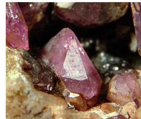
Strengit, ein seltenes Phosphatmineral von Pleystein