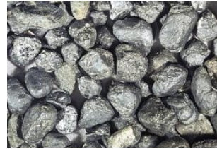
Nigrine: Pleystein (4)

Vohenstrauß im Rücken radeln wir zunächst nach Norden, gerade auf den Fahrenberg zu. In einem großen Bogen nähern wir uns diesem, um dann ganz leicht abfallend dem Radweg Richtung Pleystein weiter zu folgen. Auf der gesamten Wegstrecke von Vohenstrauß nach Pleystein durchqueren wir ein Waldgebiet und folglich fehlen uns hier Aufschlüsse und Lesesteine. Sobald wir den Wald hinter uns lassen, öffnet sich vor uns ein weites Tal mit dem Pleysteiner Kreuzberg, von der Zott umflossen. Mineralogisch gesehen könnte man sagen, wir sind im "Tal der Nigrine" angekommen. Hier finden sich in den Bächen vielfach kleine schwarze Mineralkörner, die Nigrine. In enger Verwachsung besteht der Pleysteiner Nigrin aus Ilmenit (Titaneisen) und Rutil (Titanmineral). Der Nigrin entstammt aus dem Verwitterungsschutt der Quarzgänge, die uns im Fahrenberg-Gebiet bekannt geworden sind.