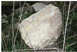
Gailertsreuth: Quarz (2)

In der Gegend um Gailertsreuth fallen immer mehr helle, ja fast weiße Steine auf den Äckern und am Wegrand auf. Es handelt sich um Quarz der hier in mehr oder weniger mächtigen Gängen und Gängen den Gneis und Granit durchschneidet. Weiter dem Bockl-Radweg folgend verlassen wir kurz vor Floß das