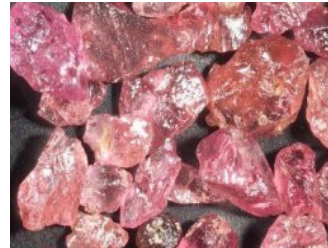
Smirgel: Albersrieth (3)

Die tiefgründige Verwitterung bescherte hier noch einen anderen Bodenschatz: Lehm. Bei Grafenreuth (C) - direkt an der Bahntrasse - wurde 1907 das Ziegelwerk Grafenreuth gegründet, das nach dem II. Weltkrieg auf über 10 Hektar mehr und weniger fette Lehmsorten abbaute und vollautomatisch mittels einem Lingl-Tunnelofen beste Ziegel produzierte. So fahren wir - ohne spektakuläre Gesteinsbildungen oder Aufschlüsse zu sehen - bis Albersrieth, einem Ort wo bis vor 50 Jahren Bergbau betrieben wurde. Von hier stammt der weltbekannte "Oberpfälzer Smirgel".